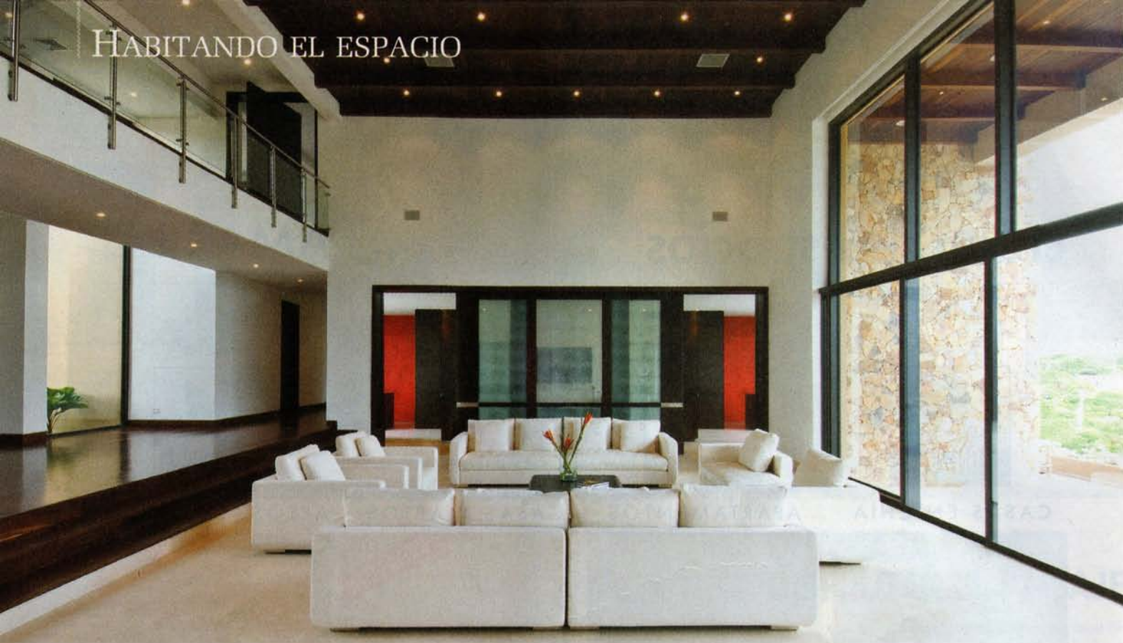
El espacio social , con una altura generosa, se abre al exterior a través de ventanas de piso a techo. Allí todo es franco y transparente. Puertas en vidrio y madera comunican con el estudio, donde se instaló el bar. En el salón sobresale su cielo raso en madera.