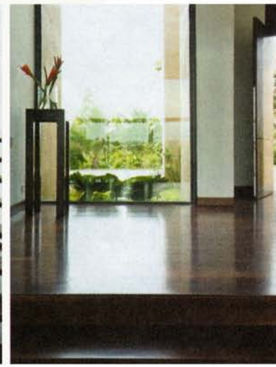
Una característica común a todos los espacios de esta casa de 1.300m 2 es abrirse al exterior para gozar de la luz natural y la naturaleza.