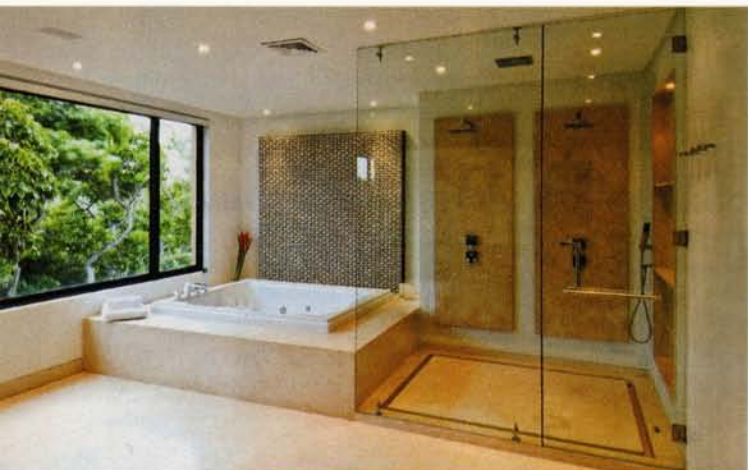
Las áreas generosas del lugar se manifiestan en este baño en el que el vidrio y las piedras naturales se conjugan para brindar confort y elegancia.

Generar ambientes transparentes, que se vieran enriquecidos con la vegetación circundante, fue una constante como lo dejan ver la cocina y los baños. La cocina bien iluminada y abierta al paisaje fue desarrollada por Sanicoc, según los planteamientos de los arquitectos. Allí se destaca la combinación de materiales, como el QuartStone, el aglomerado sintético corian, y el acero. En los baños dominan las piedras naturales.